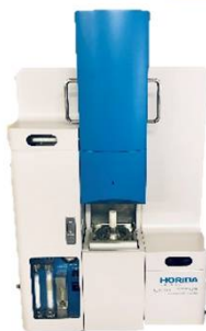
炭素・硫黄分析装置 HORIBA EMIA-920V2