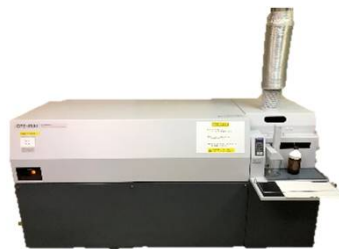
ICP-AES 島津製作所 ICPS-8100