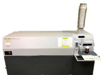
ICP-AES 島津製作所 ICPS-8100