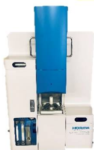
炭素・硫黄分析装置 HORIBA EMIA-920V2