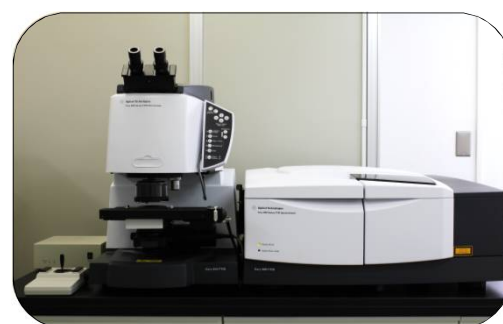
赤外分光分析装置(IR)