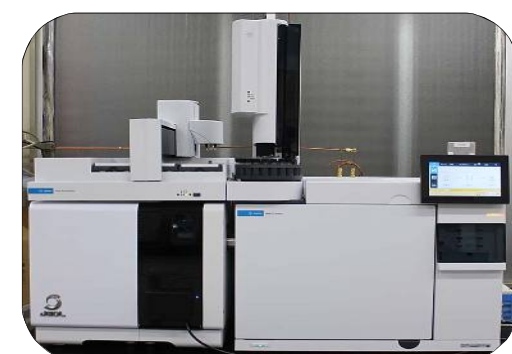
ガスクロマトグラフ質量分析装置(GC-MS)

タイルの浮きや劣化を放置すると、外壁が剥落し第三者に危害を与える危険性があります。